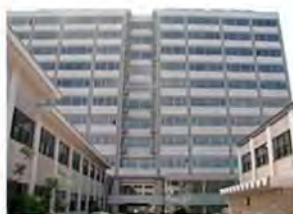
9 情報科学研究院棟入り口