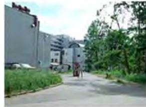
10 工学部北口玄関前