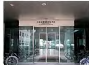
11 情報科学研究院棟正面