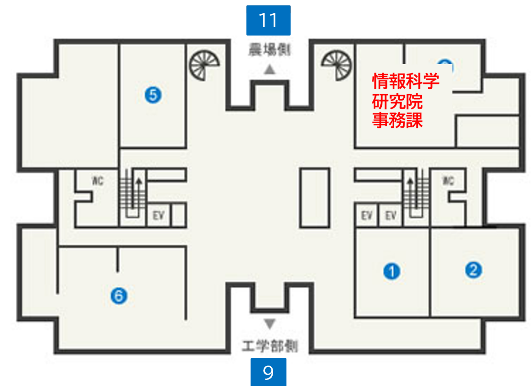
情報科学研究院棟（高層棟）1 階平面図