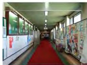
7 工学部本館ロビー奥通路